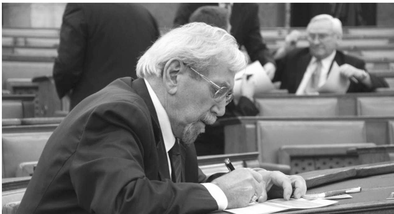
Rubovszky György az országgyűlésben írta alá a petíciót

A Országgyűlés alelnöke – aki a sajtótájékoztatóon Kalmár Ferenc kereszténydemokrata országgyűlési képviselővel együtt maga is aláírta a gyűjtőívet – kifejtette: megfelelő aktivitás esetén minden további nélkül biztosítható a kezdeményezés érvényességéhez szükséges legalább tizenhatezeröttszáz magyarországi támogató.