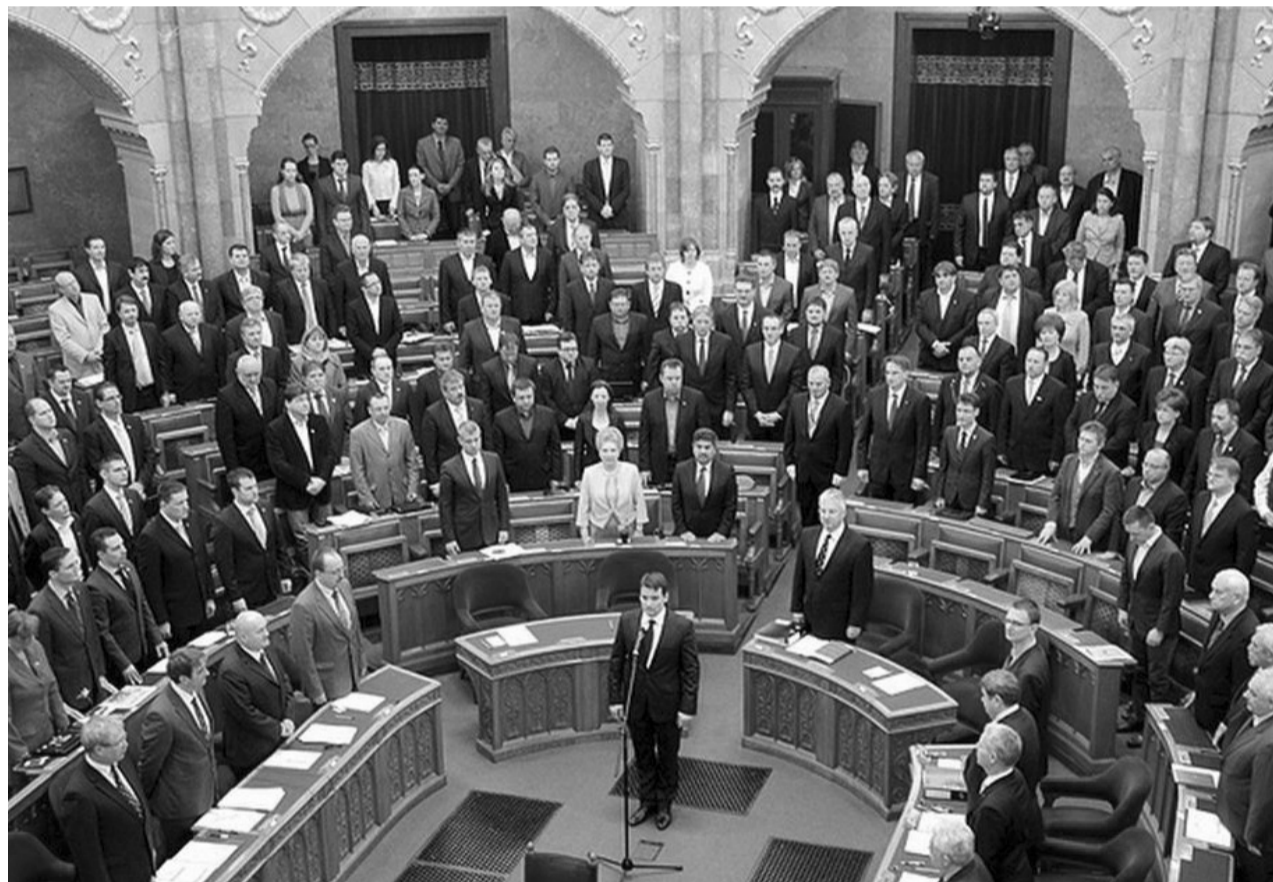
Képviselői eskütétel, 2013. március 4.

– A politikáé is. Egyrészt ezt szolgálja maga a kormányzati és pártkommunikáció, de nagy szerep jut benne pártok körül lévő szervezetek is, mint amilyen például az IKSZ. A kormányzás, a párt felől érkező információkat ezen szervezetek tagjai továbbítják a társadalom felé.