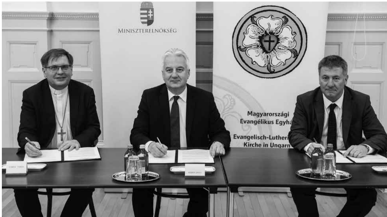
Semjén Zsolt miniszterelnök-helyettes (középen), Fabiny Tamás, a Magyarországi Evangélikus Egyház elnök-püspöke (balra) és Pröhle Gergely, a Magyarországi Evangélikus Egyház országos felügyelője

különböző egyházakkal kötött szerződések egyediek, de „egységes ívet alkotnak és egymást erősítik”. Az egyházak különböző szerkezete és sajátosságai miatt nem lehetséges általános szerződést kötni, ugyanakkor az egyedi szerződések kiegészítik egymást. Így például a Szentszékkal kötött megállapodás nemcsak a katolikus egyházat védi, hanem valójában a testvéregházakat is – mondta.