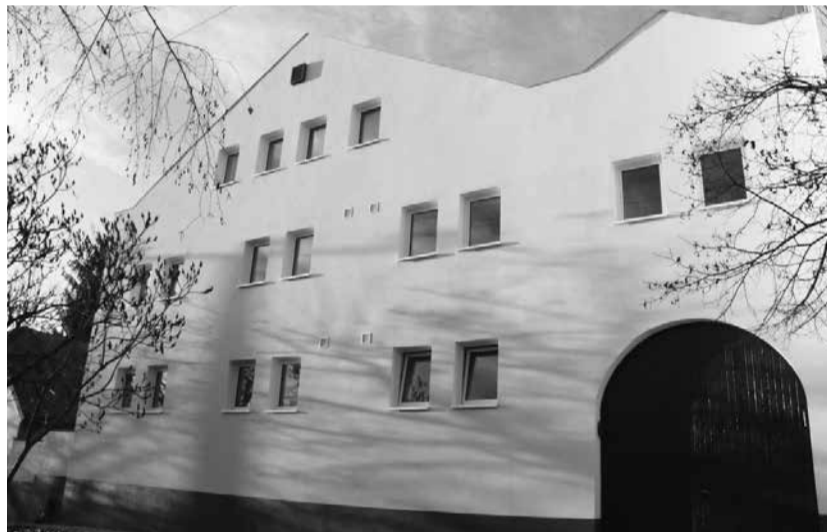
A Malom utcai iskola épülete és tornacsarnoka a 2018-as felújítást követően