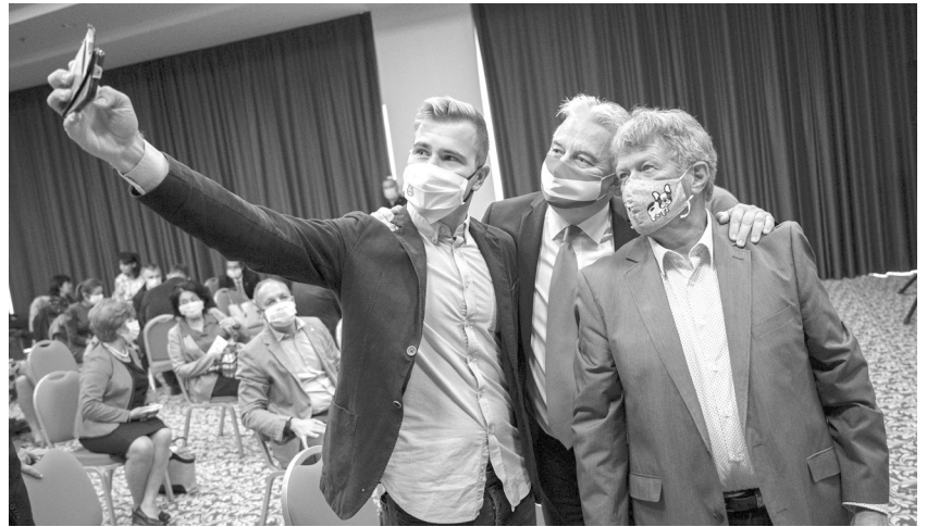
A konferencia résztvevői szelfit készítenek Semjén Zsolt pártelnökkel

A Kereszténydemokrata Önkormányzati Tanács (KÖT) az alapszabály szerint a párt azon szerve, amely összehangolja és segíti a KDNP programjának megvalósítását az ország önkormányzataiban. Megyéenként és a fővárosban önkormányzati bizottságok működnek, melynek tagjai KDNP-s polgármesterek, alpolgármesterek, közgyűlési elnökök, alelnökök és tagok, továbbá kereszténydemokrata önkormányzati képviselők, s az önkormányzati szakbizottságok külsős szakértő tagjai. Maga az országos Önkormányzati Tanács a megyei önkormányzati bizottságok elnökeiből és a megyei bizottságok által delegált tagokból áll.