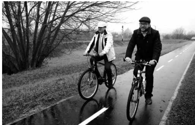
Schanda Tamás, az Innovációs és Technológiai Minisztérium parlamenti és stratégiai államtitkára, a KDNP alelnöke (jobbra) biciklizik a Zalaegerszeg és Zalalövő közötti kerékpárúton Vigh László fideszes országgyűlési képviselővel 2021. november 26-án

Arról is beszámolt, hogy a kormány által elfogadott klíma- és természet-