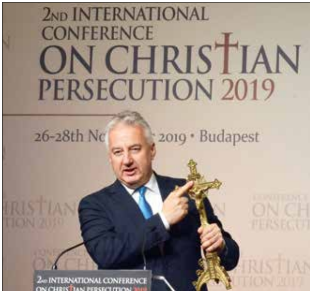
Marcell atya karmelita oltárkeresztje kalasnyikov géppisztolysorozat ütötte lyukkal