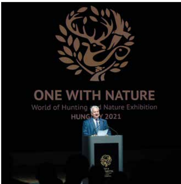
Semjén Zsolt megnyitja a Világkiállítást 2021. szeptember 25.

nem lettek volna sikeres vadászok, akkor mi most nem lennénk itt. Tehát az ember természetében benne van a vadászszenvedély. Ennek mai cizellált öröksége vadászati kultúránk. És annak bemutatása a természet felől nézve, hogy vadászat nélkül nem tartható fenn a vad és az erdő, a mezőgazdaság egyensúlya, de a vadvilág sokfélesége és a vad minősége sem.