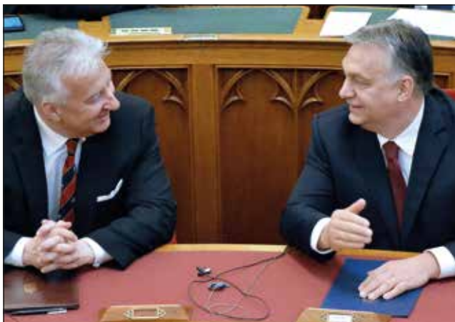
Orbán Viktor miniszterelnök, a Fidesz elnöke és Semjén Zsolt miniszterelnök-helyettes, a Kereszténydemokrata Néppárt elnöke a negyedik Orbán-kormány megalakulásakor a Parlamentben