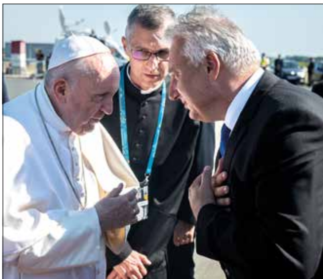
Búcsúzás a Szentatyától 2021. szeptember 12.

őrzésére hívta fel az egész világ közvéleményét. Most, a XXI. században, amikor a klasszikus értékek szétesésének időszakát éljük; amikor egyik napról a másikra emberi egzisztenciák omolhatnak össze, amikor megszokott, kiszámítható életvitelünket – minden technikai fejlettség ellenére – egy pillanat alatt megváltoztathatja egy járvány, biztos fogódzópontot keresünk. Olyan egyedülálló Értéket, amelyre mint sziklára építhetjük az életünket. Amit nem visz el az ár, sem valamely katasztrófa. Ami nem a változó és elmúló emberi álmok labilis alapzatára épül. Amikor a keresztény civilizáció globális megőrzése bizonytalanná válik, akkor a Nemzetközi Eucharisztikus Kongresszus rá-