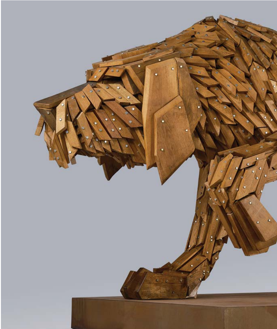
Gábor Miklós Szőke: Perro húngaro de caza