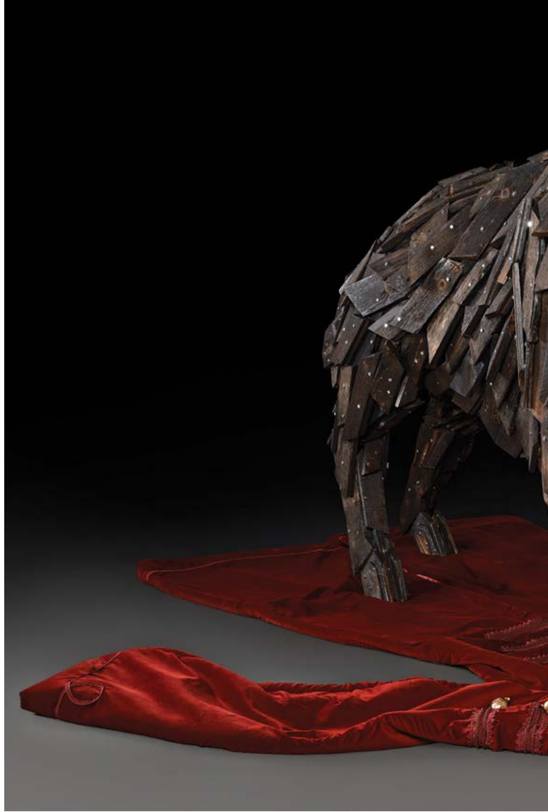
Gábor Miklós Szőke: La muerte de Zrínyi 1