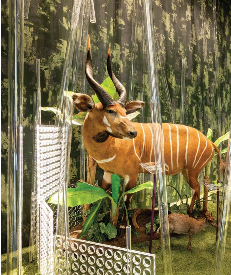
Zsolt Vasáros: Selva