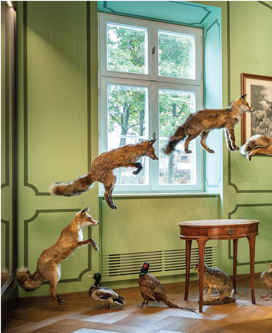
Zsolt Vasáros: Sala de cazador