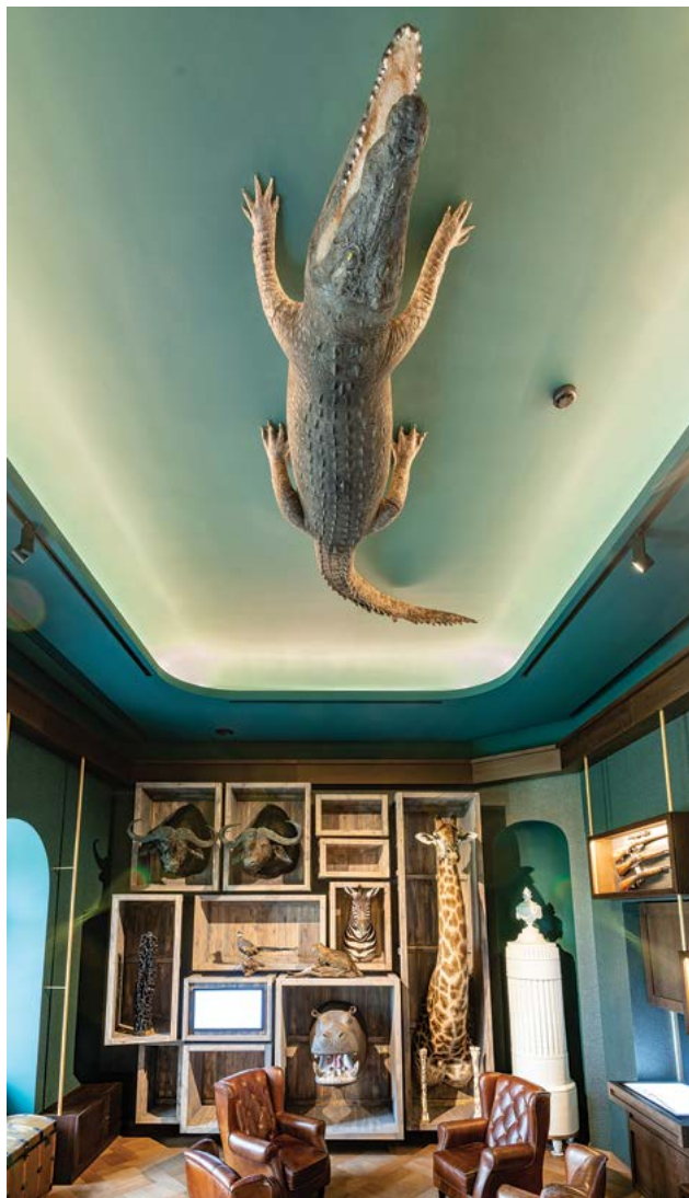
Zsolt Vasáros: Sala de fumar