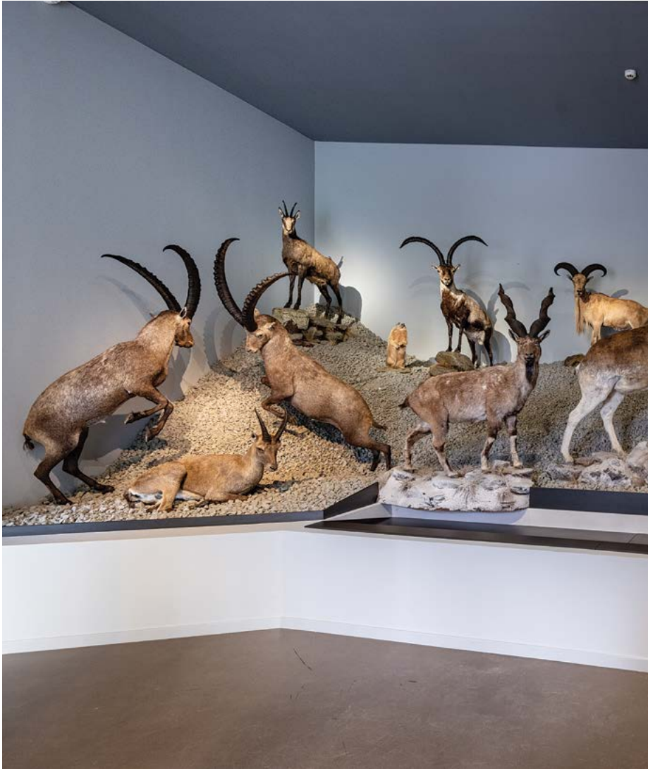
Zsolt Vasáros: Lo alto de la montaña