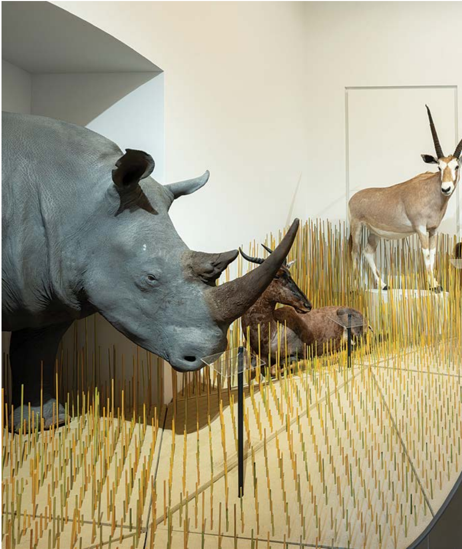
Zolt Vasáros: Savana