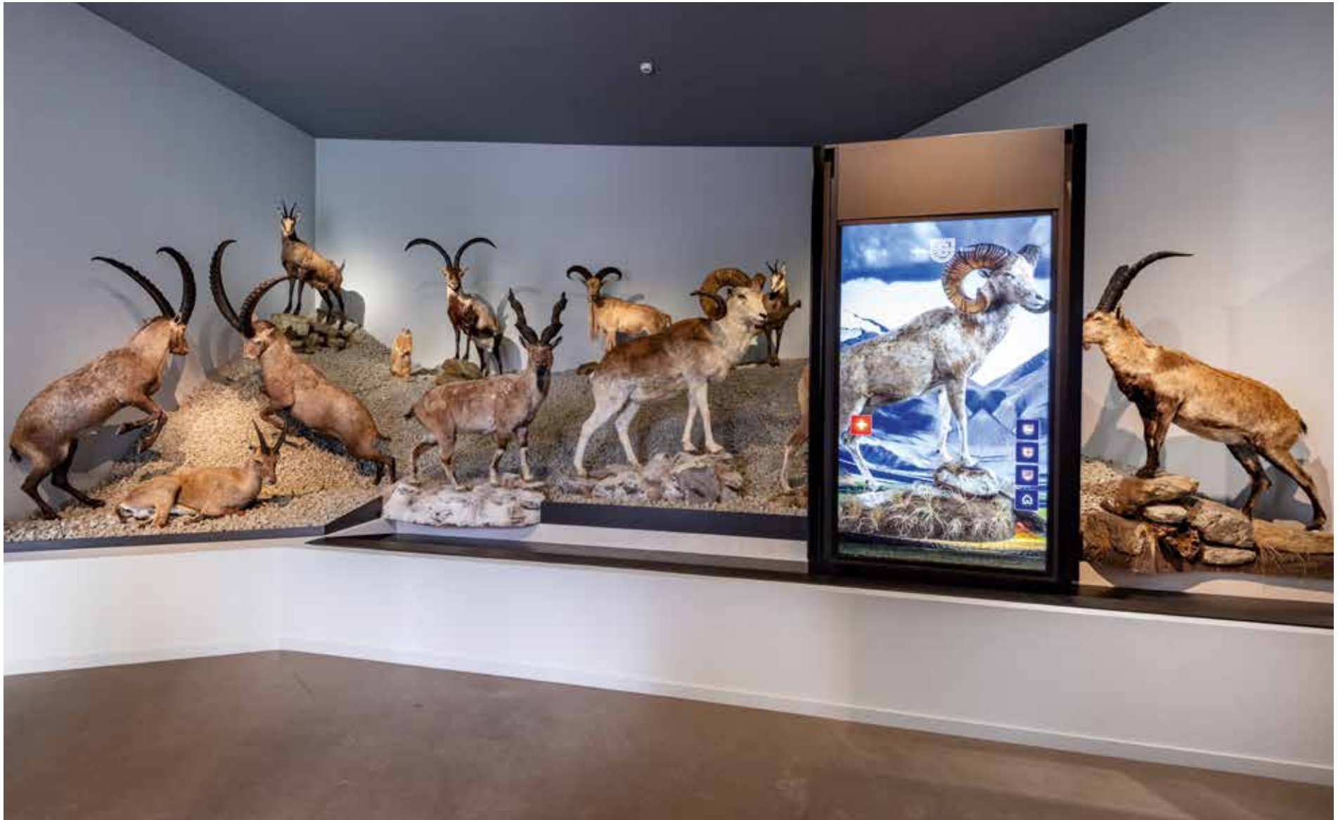
Vasáros Zsolt: Magashegy