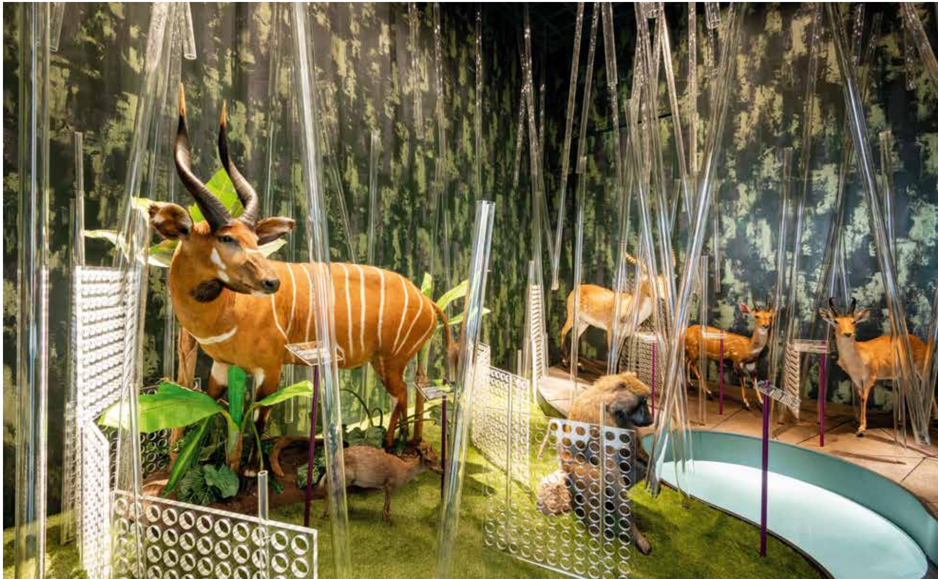
Vasáros Zsolt: Dzsungel