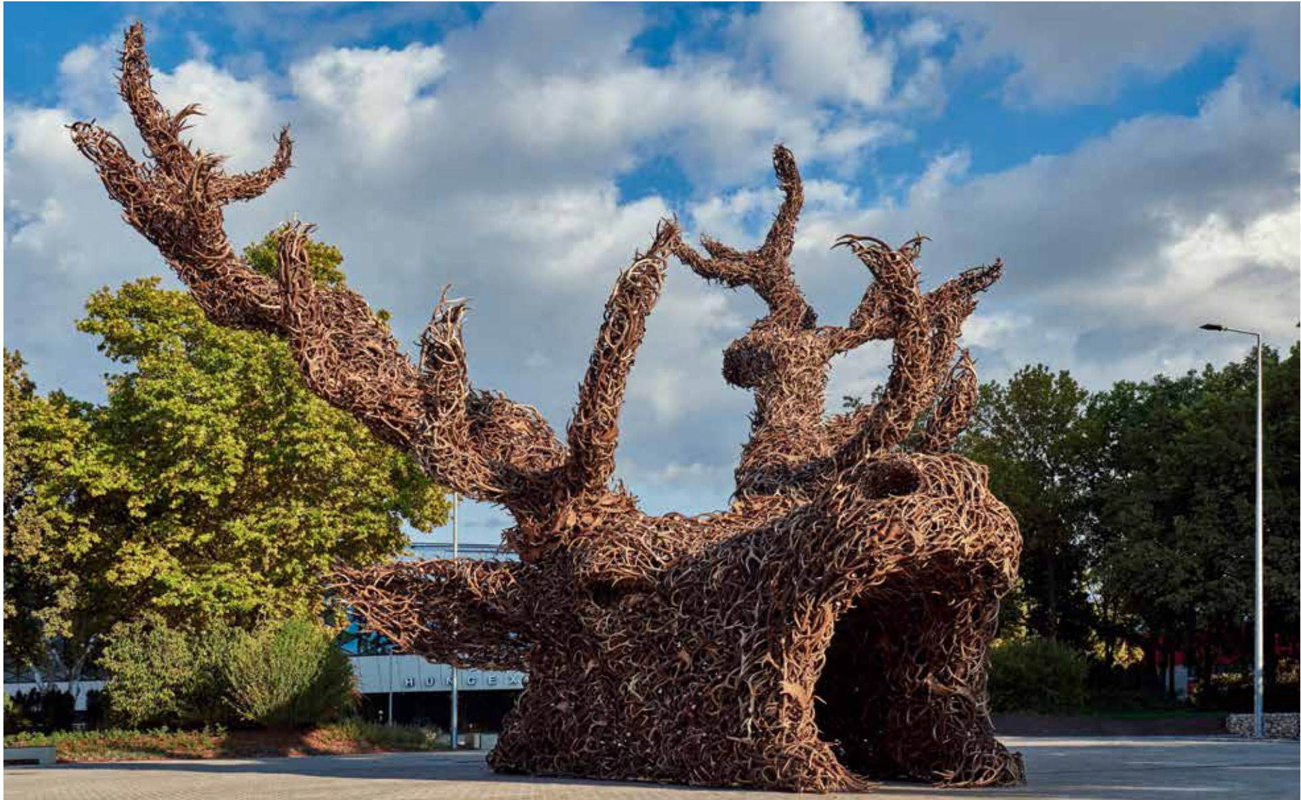
Szóke Gábor Miklós: Totem