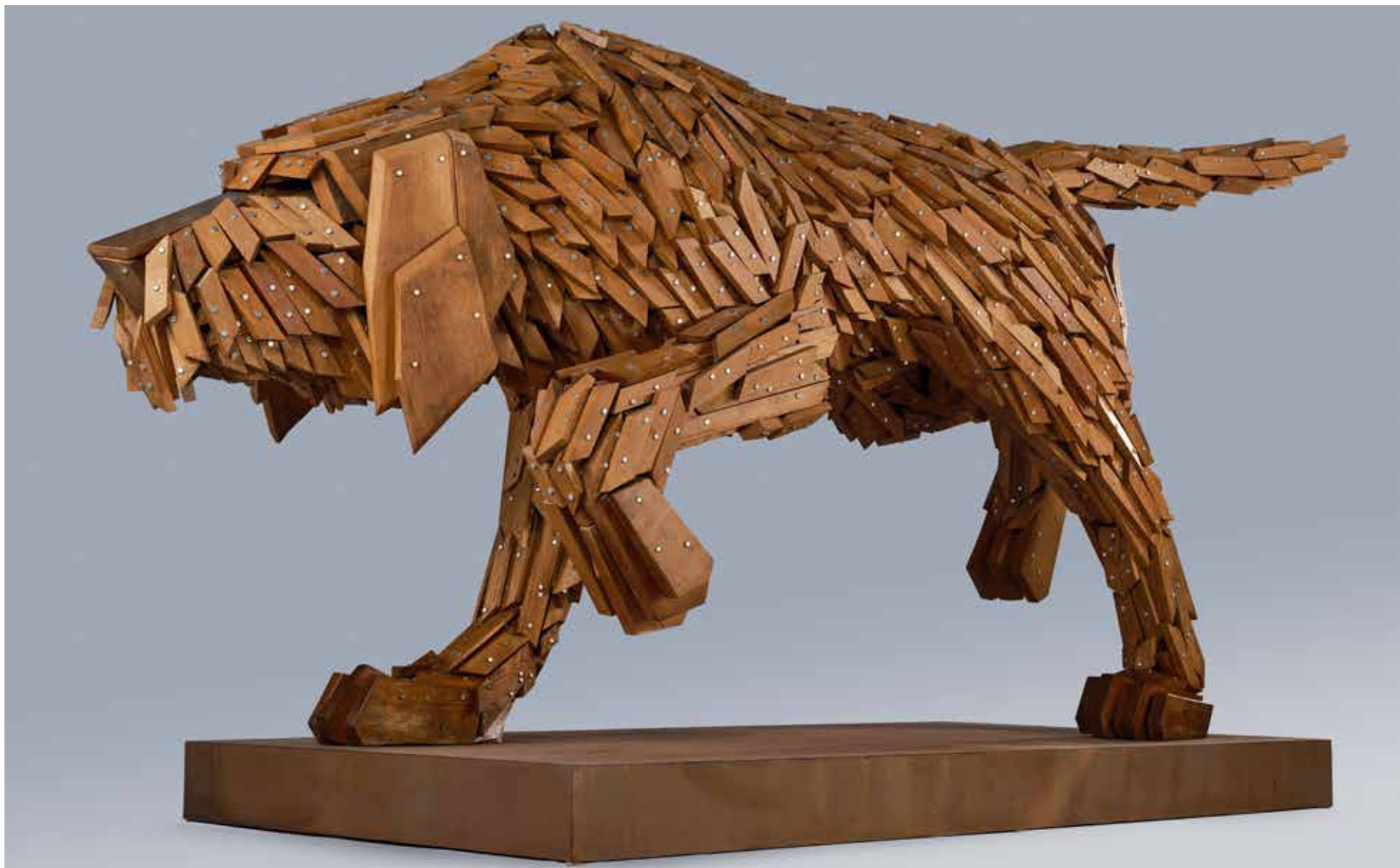
Szóke Gábor Miklós: Vizslató Fátyol