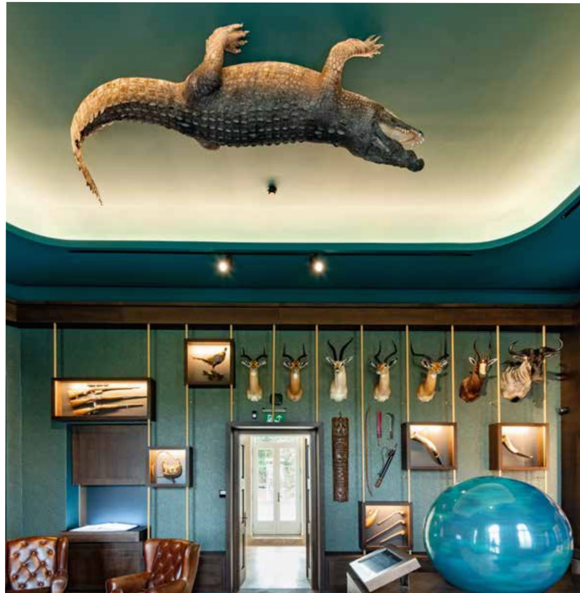
Vasáros Zsolt: Szivarszoba