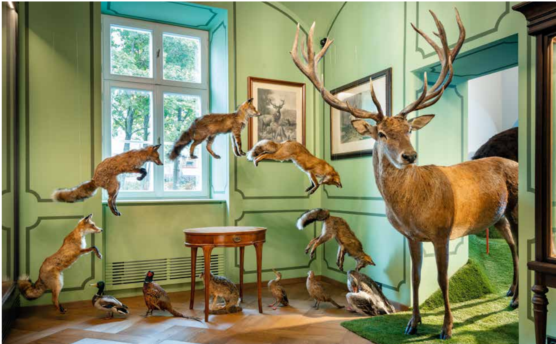
Vasáros Zsolt: Vadászszoza