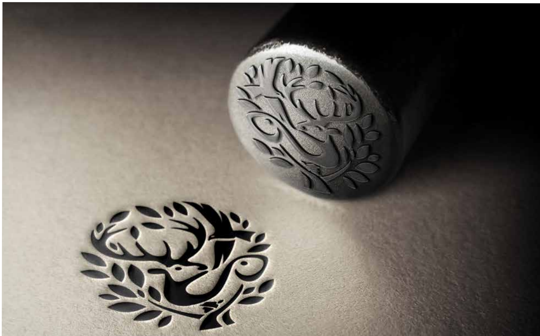
Egy a Természettel