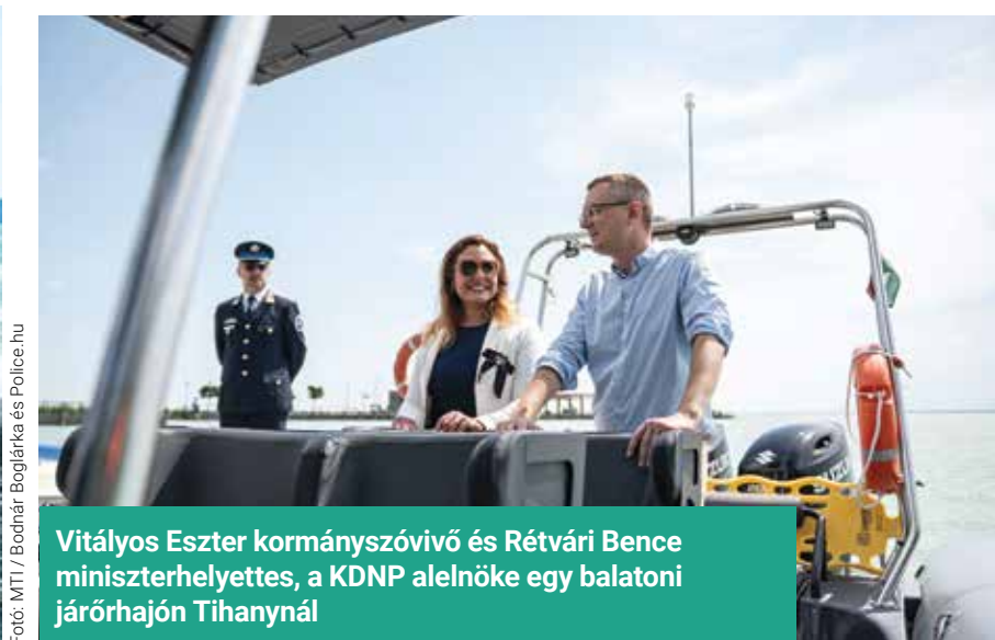
Vitályos Eszter kormányzóvivő és Rétvári Bence miniszterhelyettes, a KDNP alelnöke egy balatoni járőrhajón Tihanyánál

Rétvári Bence hangsúlyozta: a kormánynak kiemelten fontos, hogy minden turista biztonságban érezze magát a Balatonnál és minden más kiemelt turisztikai területen. Ezért a Balatonnál nyáron nagyobb a rendőri jelenlét a bűncselekmények megelőzése, a közlekedés biztonságának fenntartása és az emberek védelme érdekében – tette hozzá.