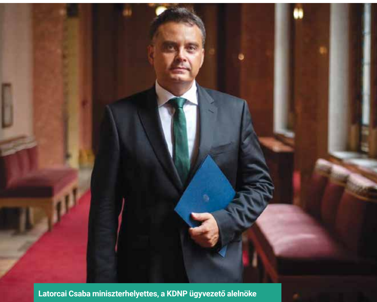
Latorcai Csaba miniszterhelyettes, a KDNP ügyvezető alelnöke

Újrászó és új polgármesterek, valamint képviselők sora fémjelzi azt, hogy erős a KDNP jelenléte az önkormányzatokban országszerte. Mindez a kemény munka eredménye ott, ahol a helyi és az országos együttműködést komolyan vették jelöltjeink. A KDNP sikere a helyi közösség sikere is. Ahol most nem sikerült, ott pedig legyen tanulság, hogy csak egységben van erő.