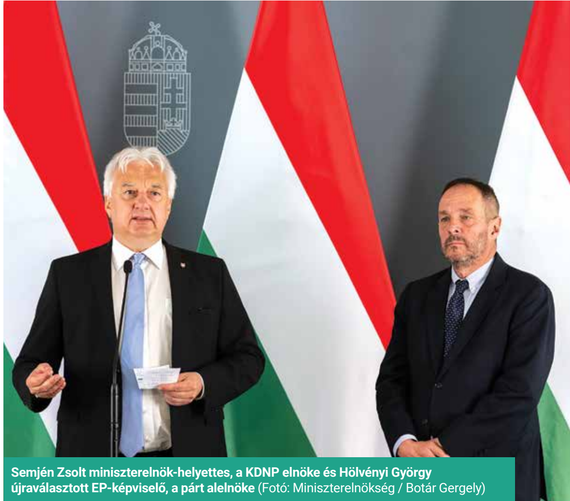
Semjén Zsolt miniszterelnök-helyettes, a KDNP elnöke és Hölvényi György újraválasztott EP-képviselő, a párt alelnöke

Semjén Zsolt elnök Hölvényi György alelnök, EP-képviselő