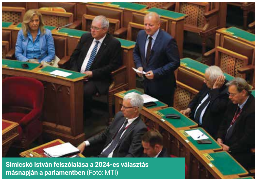
Simicskó István felszólalása a 2024-es választás másnapján a parlamentben

Simicskó István, a KDNP frakcióvezetője a választás másnapján napirend előtt arról beszélt az Országgyűlésben, hogy az európai parlamenti és az önkormányzati választást is a Fidesz–KDNP nyerte meg. Megköszönte a szavazók bizalmát és az aktivisták, segítők „fantasztikus munkáját”, ami – mint mondta – a siker alapja, záloga volt.