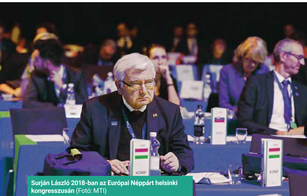
Surján László 2018-ban az Európai Néppárt helsinki kongresszusán

A szerző a KDNP tiszteletbeli elnöke, az Európai Parlament korábbi alelnöke